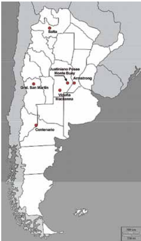
Figura 2. Emplazamiento de algunos proyectos piloto que involucran dispositivos de medición inteligente en el marco de una REI en el ámbito de la República Argentina